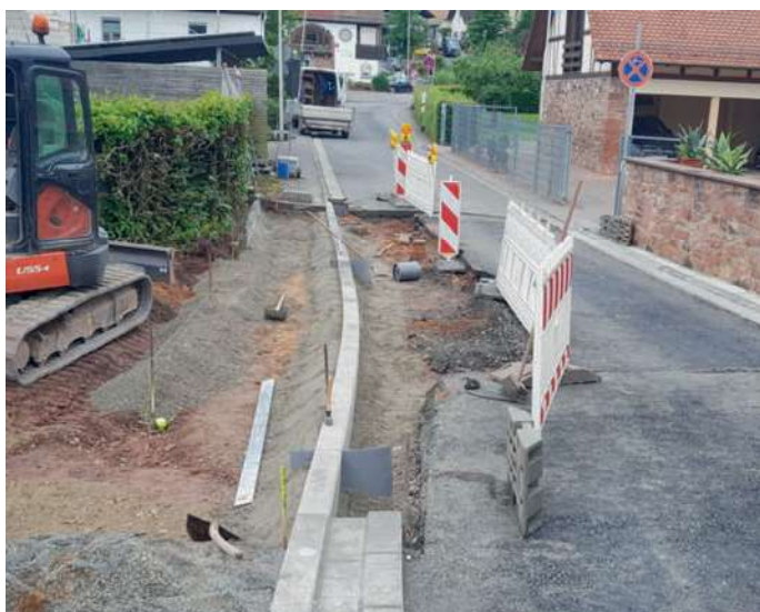
Abb.: Arbeiten am neuen Gehweg

Aktuelle Bauarbeiten/Mitteilungen: Pflaster- und Asphaltarbeiten