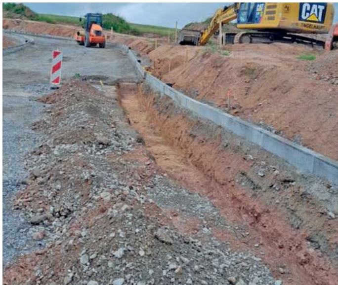
Abb.: Vorbereitungen zum Verlegen der Versorger-Infrastruktur

Aktuelle Bauarbeiten/Mitteilungen: Ausbau der Versorger-Infrastruktur